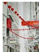
Titouan Lamazou – La Chine